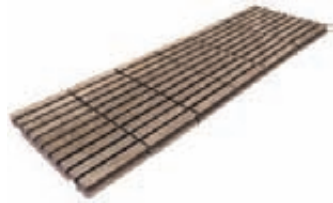
REJILLA CERÁMICA EVACUACIÓN: 19 m 3 /h BR-RJC59-500 500 x 245 x 25