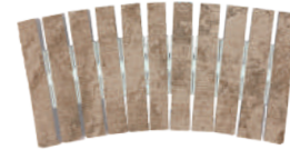
ESQUINA REJILLA CERÁMICA CURVABLE EVACUACIÓN: 19 m 3 /h BR-RJC59-500CU 500 x 245 x 25