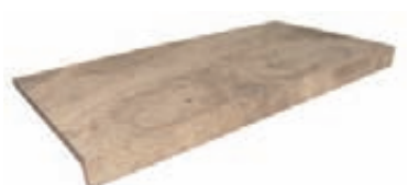
PELDAÑO RECTO EVO BR-551592 625 x 317 x 40