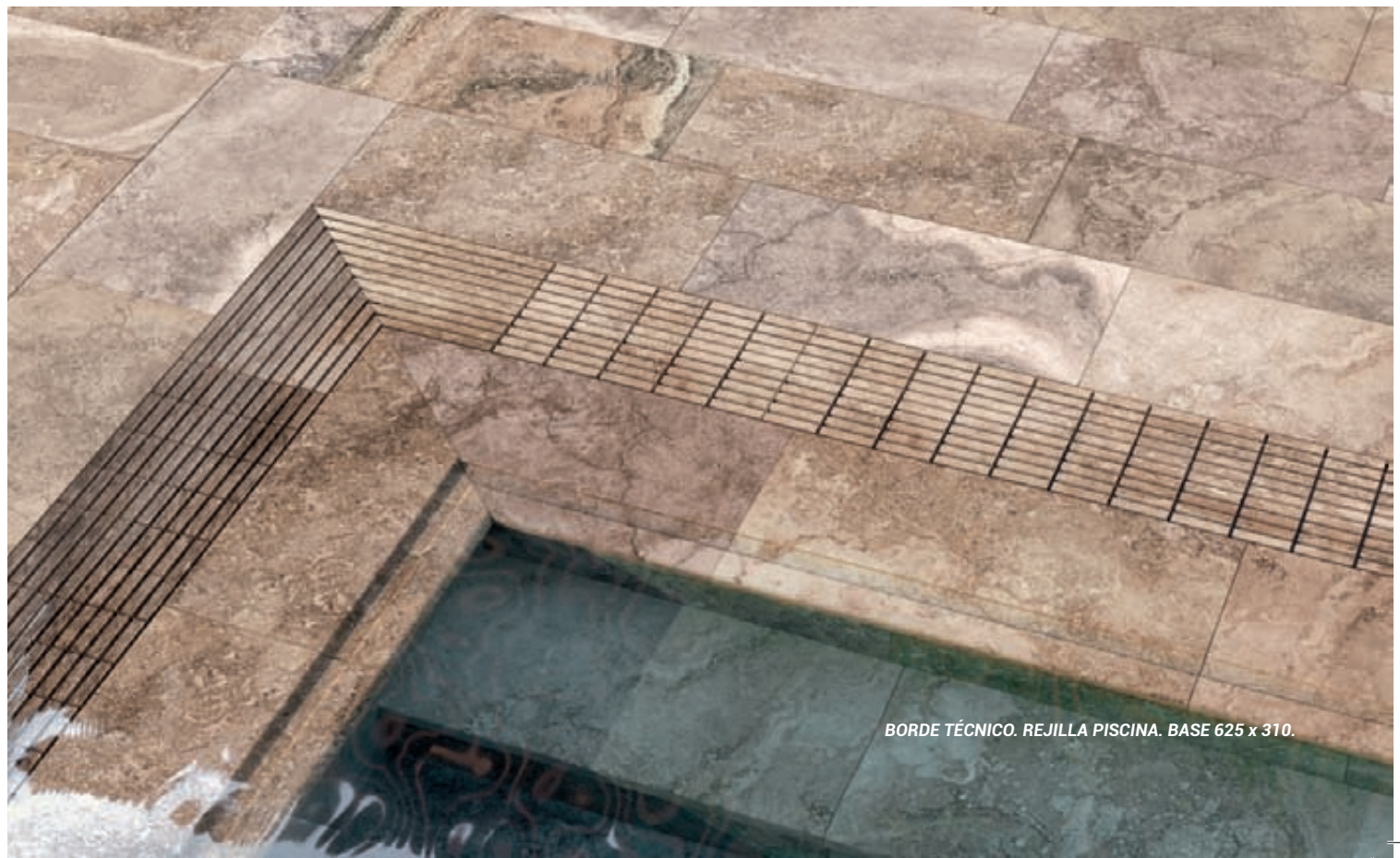
BORDE TÉCNICO. REJILLA PISCINA. BASE 625 x 310.