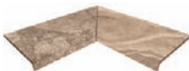
CARTABÓN INT. PELD. RECTO EVO BR-569592 625 x 625 x 40