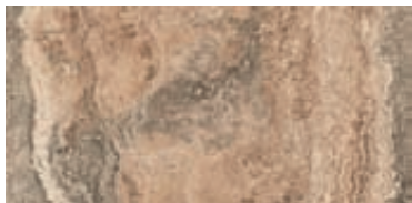
BASE BR-550591 625 x 310 x 10