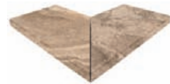
CARTABÓN EXT. PELD. RECTO EVO BR-570592 625 x 625 x 40