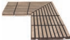
ESQUINA REJILLA CERÁMICA EVACUACIÓN: 19 m 3 /h BR-RJC59 450 x 450 x 25