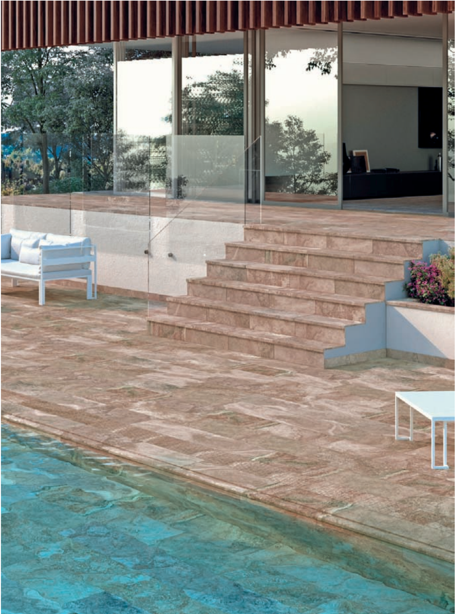
BERMEO. BORDE TÉCNICO. REJILLA CERÁMICA.