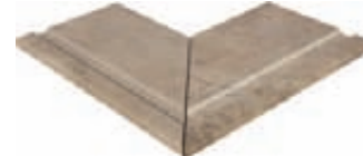
CARTABÓN EXT. BORDE TÉCNICO BR-581592 625 x 625 x 23