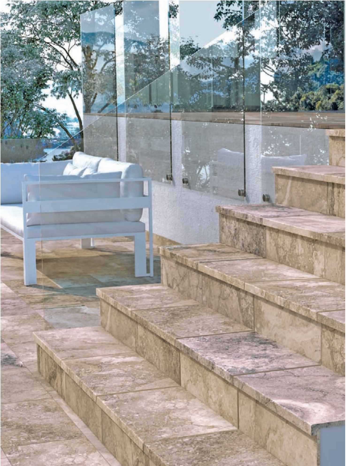
BERMEO. PELDAÑO RECTO EVO 625 x 317.