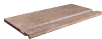
BORDE TÉCNICO BR-579592 625 x 330 x 23