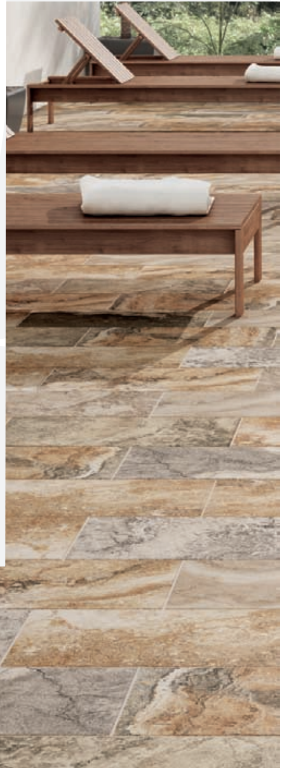
BERMEO. BASE 625 x 310. PELDAÑO RECTO EVO 625.