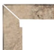
ZANQUÍN RECTO EVO BR-152592 Drcho. BR-153592 Izdo. 305 x 270 x 86